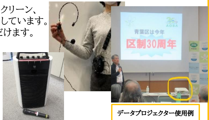
データプロジェクター使用例