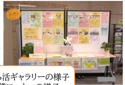
上:まち活ギャラリーの様子 下:貸ロッカーの様子